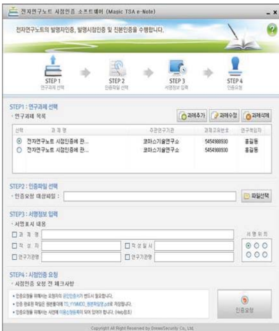
제품 메인 화면